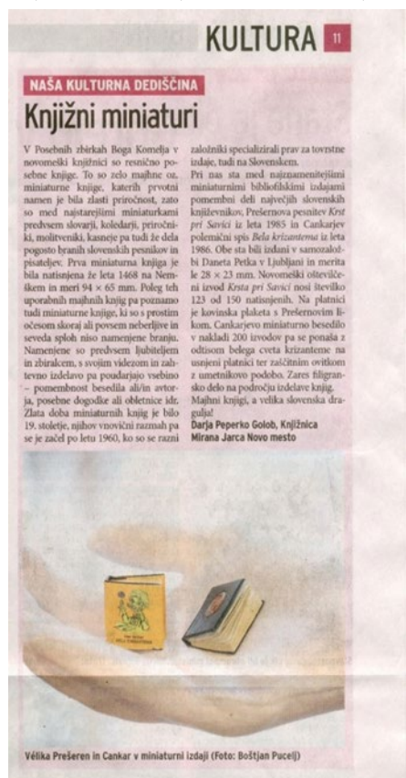
Slika 50: Publicistična dejavnost: predstavitev gradiva iz Posebnih zbirk Boga Komelja v časniku Dolenjski list

Publicistična dejavnost knjižnice z bogato kulturno dediščino je pomemben prispevek k prepoznavanju knjižnice in okolja, v katerem deluje, skozi čas.