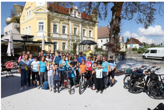
Slika 54: Ob evropskem tednu mobilnosti smo v sklopu sodelovanja z občino Šmarješke Toplice in certifikata Kolesarju prijazni skupaj s partnerji pripravili kolesarjenje od Novega mesta do Šmarjete in nazaj.

V letu 2024 smo na področju prireditvene dejavnosti poglobili sodelovanje z občinama sofinancerkama, ki nimata svoje krajevne knjižnice. V občini Šmarješke Toplice smo tako v sodelovanju z Zavodom za turizem, kulturo in šport Šmarješke Toplice organizirali 5 dogodkov, s katerimi smo se vključili v aktualno lokalno dogajanje, tamkajšnjo šolo in vrtec pa je obiskal tudi bibliobus. V občini Mirna Peč smo v sodelovanju z Muzejem Lojzeta Slaka in Toneta Pavčka organizirali glasbeno-pravljični dogodek, na katerem so se otroci ob glasbi in pravljici Prigode polžka Petra potepali po Polžjem mestu.