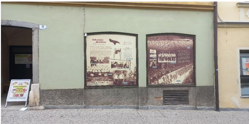
Slika 46: Razstava »Sokolsko društvo v Novem mestu« v izložbah nekdanjega trgovskega lokala na Rozmanovi ulici v Novem mestu

Razstave so bile glede na povratne informacije in izraženo zanimanje s strani uporabnikov opažene in obiskane.