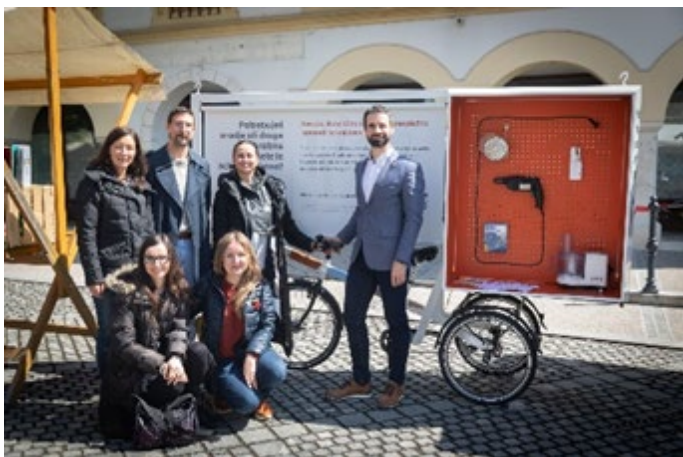
Slika 53: Predstavniki partnerskih organizacij ob premični enoti Knjižnice reči Novo mesto na novomeškem Glavnem trgu.