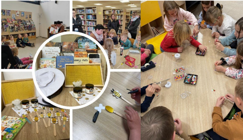
Slike 22 in 23: Ure pravljic in ustvarjalne delavnice

Pravljične ure z ustvarjalno delavnico: v mesecu oktobru so že tradicionalno zaživele mesečne pravljичne urice z ustvarjalno delavnico, ki so skozi celotno sezono zelo dobro obiskane.