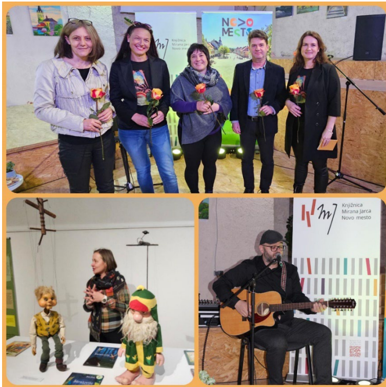
Slika 3: Pravljični večer za odrasle v Knjižnici Mirana Jarca Novo mesto, 2024

Teden znanstvene fantastike in fantazije: v sklopu tematskega tedna, ki smo ga poimenovali Znanost ali fantazija? smo vse ljubitelje vesolja in sodobne tehnologije, skupaj s Centrom vesoljskih tehnologij Hermana Potočnika Noordunga, povabili na virtualni sprehod po mednarodni vesoljski postaji. Fantazijsko obarvane so bile tudi ure pravljic ter ustvarjalna delavnica.