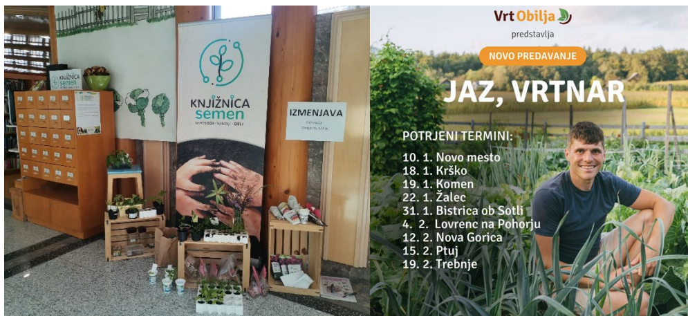
Sliki 59 in 60: Izmenjava semen in sadik v novomeški knjižnici in predavanje Vrta obilja »Jaz, vrtnar«

Vrta obilja z naslovom Jaz, vrtnar, v maju organizirali izmenjavo semen in sadik ter sodelovali na Zeleni tržnici v Stopičah, v novembru pa smo se udeležili 3. srečanja skrbnikov Knjižnic semen, ki je potekalo v Knjižnici Rogaška Slatina. Knjižnica semen je konec leta 2024 beležila 385 uporabnikov, ki so v preteklem letu vnesli v bazo knjižnice semen 129 različnih semen in si izposodili 468 vrečk semen.