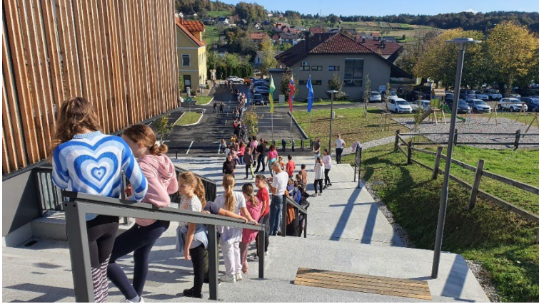
Slika 36: Živa veriga v oktobru

12. oktobra 2024 smo izvedli veliko (javno) selitev gradiva iz starih v nove prostore knjižnice. Odziv je bil neverjeten, saj se je vabilu »na pomoč« odzvalo preko 150 ljudi iz bližnje in širše okolice. Vzdušje je bilo čudovito, skupaj smo opravili veliko delo, za konec pa smo se razvajali še ob dobrotah, ki jih je za nas pripravilo Društvo podeželskih žena Škocjan.