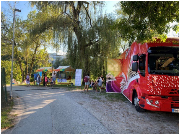
Slika 7: Sodelovanje na Festivalu mladih na Loki v Novem mestu

Sodelovanje na Festivalu mladih: predstavitev bibliobusa in Knjižnice Mirana Jarca Novo mesto na Festivalu mladih na Loki v Novem mestu.