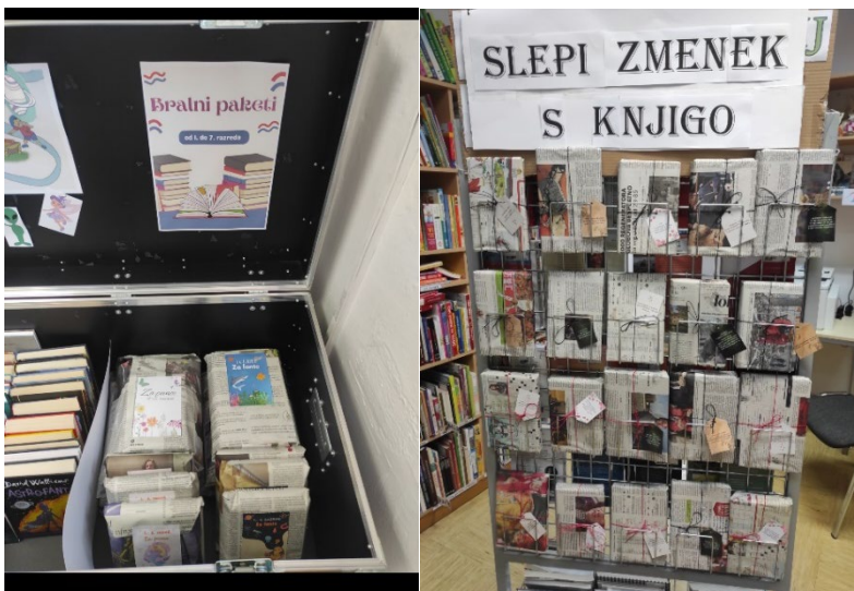
Sliki 15 in 16: Bralni paketi za mlade in odrasle