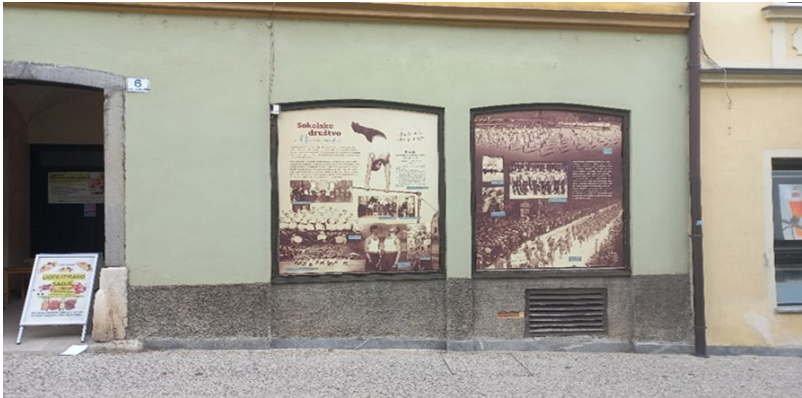
Slika 46: Razstava »Sokolsko društvo v Novem mestu« v izložbah nekdanjega trgovskega lokala na Rozmanovi ulici v Novem mestu

Razstave so bile glede na povratne informacije in izraženo zanimanje s strani uporabnikov opažene in obiskane.