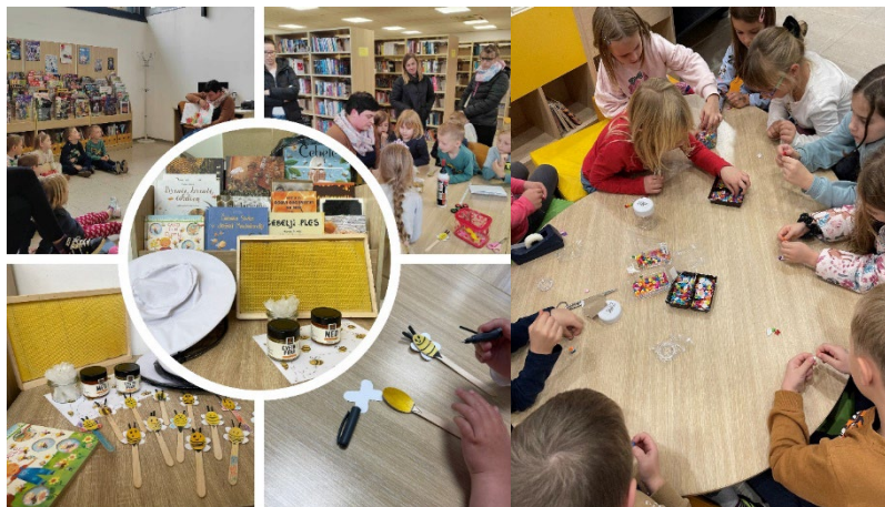
Slike 22 in 23: Ure pravljic in ustvarjalne delavnice

Pravljične ure z ustvarjalno delavnico: v mesecu oktobru so že tradicionalno zaživele mesečne pravljичne urice z ustvarjalno delavnico, ki so skozi celotno sezono zelo dobro obiskane.