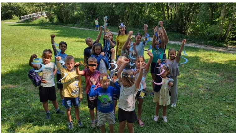
Slika 35: Avgustovske bralno-ustvarjalne delavnice

Avgustovske bralno-ustvarjalne delavnice so bile ponovno pravi hit. Otroci so se z velikim veseljem udeleževali druženj ob Radulji, v slabem vremenu pa smo se umaknili kar v veliko ali malo dvorano Metelkovine.