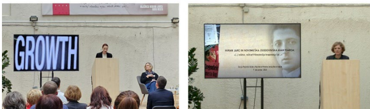
Slika 1: Knjižnica – igrišče znanja in zabave