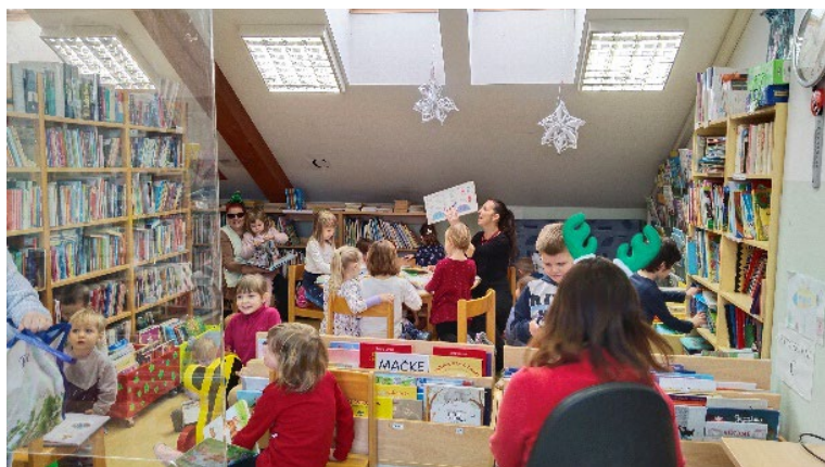
Slika 37: Vrtec na obisku decembra

Skozi vse leto 2024 so Krajevno knjižnico Dvor obiskovali otroci iz vrtca in šole na Dvoru in v Žužemberku. Prisluhnilo so pravljicam, se naučili lepega ravnanja s knjigami in vedenja v knjižnici ter se seznanili s knjigami, ki so primerne za njih.