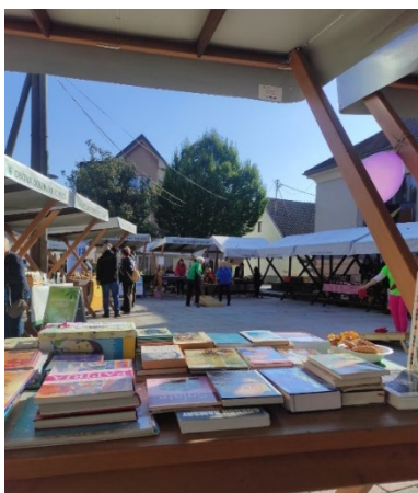
Slika 13: Bukvarnica v okviru Evropskega tedna mobilnosti

Jeseni smo v sklopu Evropskega tedna mobilnosti na ploščadi pred KKC pripravili bukvarnico ter potopisni pogovor o prehojenem portugalskem delu znamenite romarske poti El Camino.