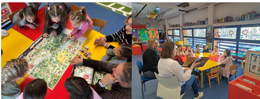
Sliki 43 in 44: Slovurice« za predšolske otroke v Karlovcu

V sodelovanju z Dolenjskim muzejem Novo mesto smo v okviru tečaja slovenskega jezika »Slovurice« za predšolske otroke predstavili tudi del slovenske nesovne kulturne dediščine – pripovedništvo in med drugim urili tehniko pripovedovanja zgodb.