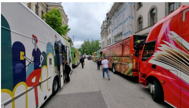
Slika 8: Sodelovanje na Festivalu potujočih knjižnic v Ljubljani

Sodelovanje z bibliobusom na Festivalu potujočih knjižnic v Ljubljani.