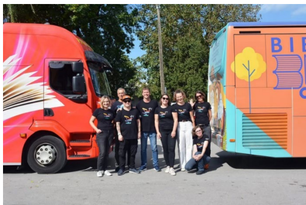
Slika 5: Bibliobusiranje – s hrvaškimi kolegi iz Mestne knjižnice »Ivan Goran Kovačić« Karlovec

Bibliobusiranje: konec septembra smo že drugo leto zapored izvedli enodnevno srečanje potujočih knjižnic (slovenskega in hrvaškega bibliobusa) na območju, kjer živijo tudi pripadniki slovenske narodnostne skupnosti na Hrvaškem.