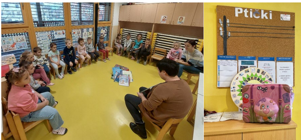
Sliki 26 in 27: Projekt za spodbujanje družinske bralne pismenosti »Doživi svet pravljic s pravljničnim kovčkom«

Počitniški bralno ustvarjalni paketi: bralno spodbujevalni projekt, ki je potekal že tretje leto med poletnimi počitnicami. Namen projekta je spodbujanje predvsem mladih bralcev in njihovih staršev k obiskovanju knjižnice, branju različnih besedil in širitvi splošne razgledanosti, razvijanju odnosa do knjig in hkrati tudi h koristnemu preživljanju prostega časa. V času od junija do avgusta smo pripravili bralno ustvarjalne pakete po izboru knjižničarke. Paketi so razdeljeni na štiri starostne stopnje in vsebujejo pet knjig različnih tematik po izboru.