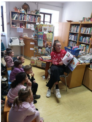
Slika 12: Branje pravljice prvošolcem na obisku v knjižnici

Aprila smo v avli Kongresno kulturnega centra Dolenjske Toplice poleg aktivnosti, namenjenih izobraževanju o čebelah, odprli razstavo Čebele – prijateljice za življenje , ki je bila na ogled do julija. Ob koncu šolskega leta smo v sodelovanju s šolsko knjižnico OŠ Dolenjske Toplice pripravili zaključni dogodek za zlate bralce , kjer so se učenci urili in zabavali ob igranju družabne igre o lažnih novicah.