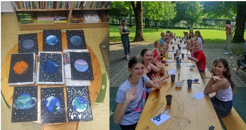
Sliki 9 in 10: Poletne ustvarjalne delavnice, kjer smo ustvarjali na temo vesolja

Poletne ustvarjalne delavnice v parku , ki so bile izjemno dobro obiskane, ter ustvarjalna delavnica na ploščadi pred KKC v sklopu prireditve Topliško jabolko.