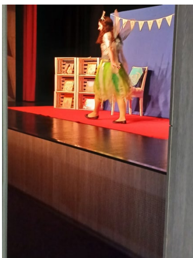
Slika 19: Predstava V knjigi skriti zaklad ob 10-letnici selitve knjižnice