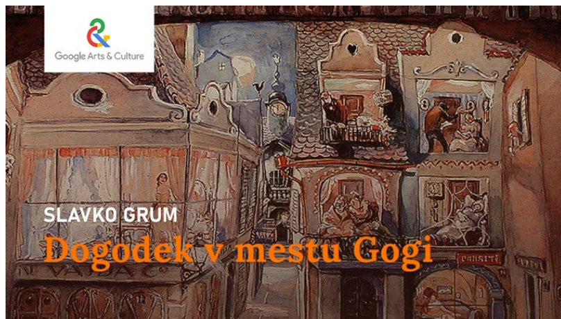
Slika 47: Virtualna predstavitev »Kje je mesto Goga?« na mednarodni spletni platformi Google Arts & Culture

Razstava je imela v letu 2024 1799 ogledov.