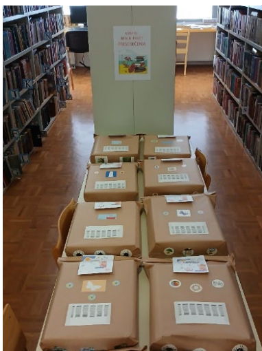
Slika 20: Paketi presenečenja za poletno branje