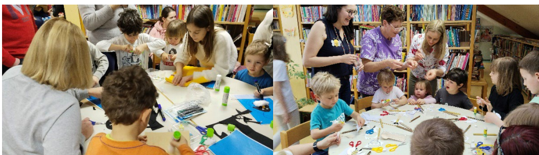
Sliki 41 in 42: Utrinki z ustvarjalne delavnice