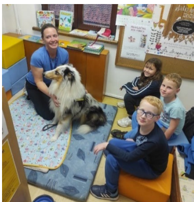
Slika 14: Premierno Branje s tačkami