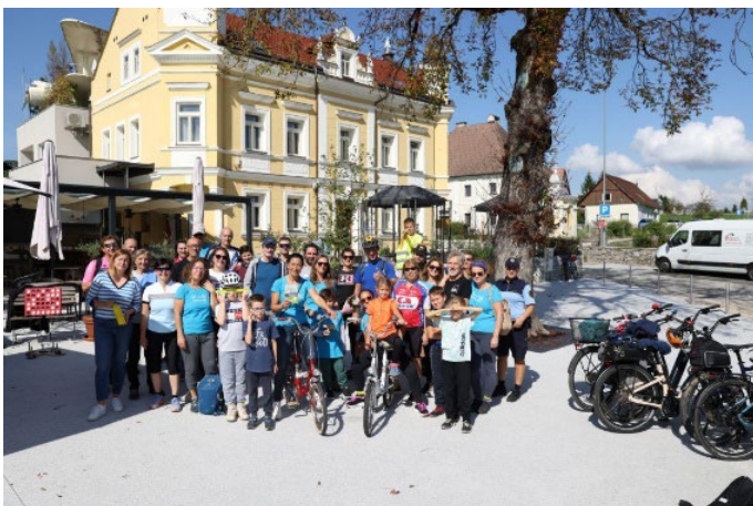
Slika 54: Ob evropskem tednu mobilnosti smo v sklopu sodelovanja z občino Šmarješke Toplice in certifikata Kolesarju prijazni skupaj s partnerji pripravili kolesarjenje od Novega mesta do Šmarjete in nazaj.

V letu 2024 smo na področju prireditvene dejavnosti poglobili sodelovanje z občinama sofinancerkama, ki nimata svoje krajevne knjižnice. V občini Šmarješke Toplice smo tako v sodelovanju z Zavodom za turizem, kulturo in šport Šmarješke Toplice organizirali 5 dogodkov, s katerimi smo se vključili v aktualno lokalno dogajanje, tamkajšnjo šolo in vrtec pa je obiskal tudi bibliobus. V občini Mirna Peč smo v sodelovanju z Muzejem Lojzeta Slaka in Toneta Pavčka organizirali glasbeno-pravljični dogodek, na katerem so se otroci ob glasbi in pravljici Prigode polžka Petra potepali po Polžjem mestu.