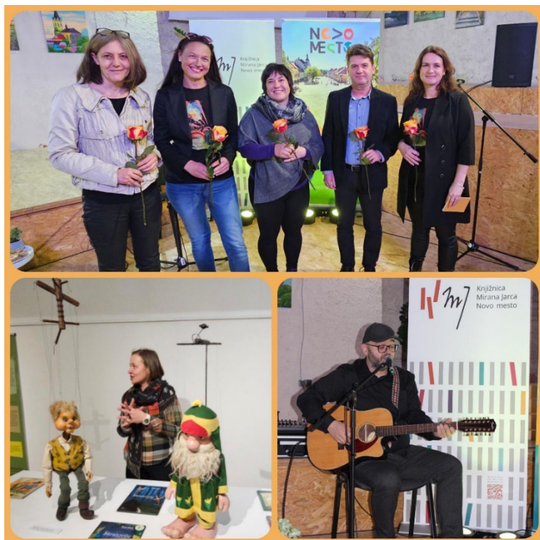
Slika 3: Pravljični večer za odrasle v Knjižnici Mirana Jarca Novo mesto, 2024

Teden znanstvene fantastike in fantazije: v sklopu tematskega tedna, ki smo ga poimenovali Znanost ali fantazija? smo vse ljubitelje vesolja in sodobne tehnologije, skupaj s Centrom vesoljskih tehnologij Hermana Potočnika Noordunga, povabili na virtualni sprehod po mednarodni vesoljski postaji. Fantazijsko obarvane so bile tudi ure pravljic ter ustvarjalna delavnica.