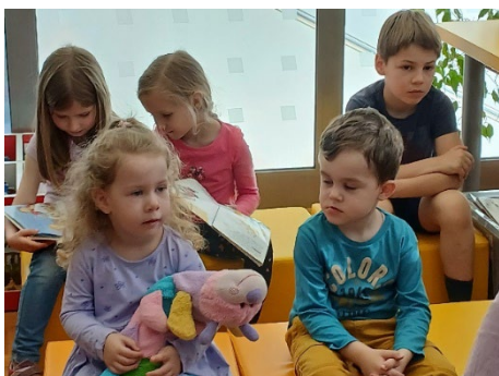
Slika 17: Na uri pravljic