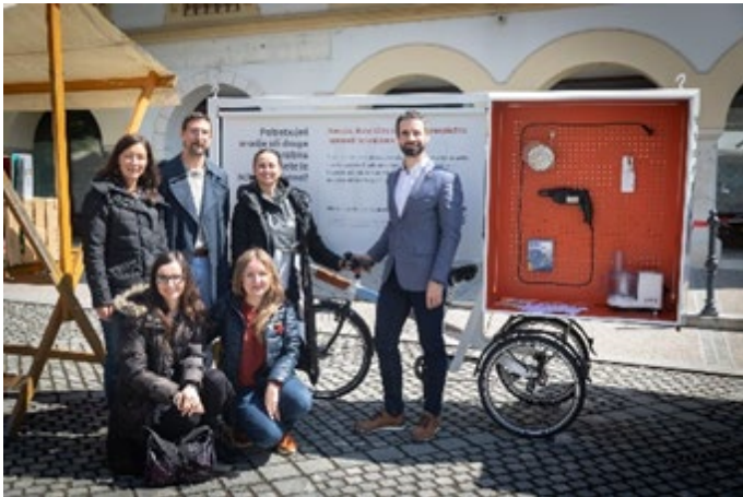
Slika 53: Predstavniki partnerskih organizacij ob premični enoti Knjižnice reči Novo mesto na novomeškem Glavnem trgu.