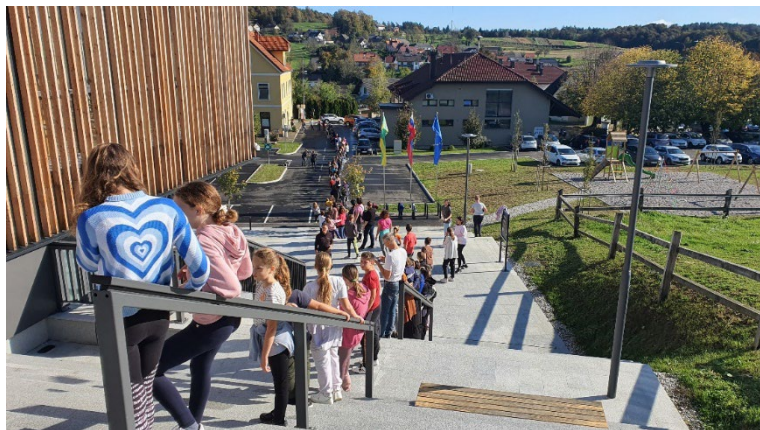
Slika 36: Živa veriga v oktobru

12. oktobra 2024 smo izvedli veliko (javno) selitev gradiva iz starih v nove prostore knjižnice. Odziv je bil neverjeten, saj se je vabilu »na pomoč« odzvalo preko 150 ljudi iz bližnje in širše okolice. Vzdušje je bilo čudovito, skupaj smo opravili veliko delo, za konec pa smo se razvajali še ob dobrotah, ki jih je za nas pripravilo Društvo podeželskih žena Škocjan.