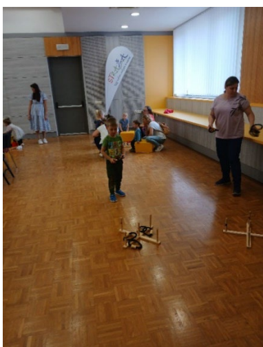
Slika 18: Zaključek pravljicnih ur