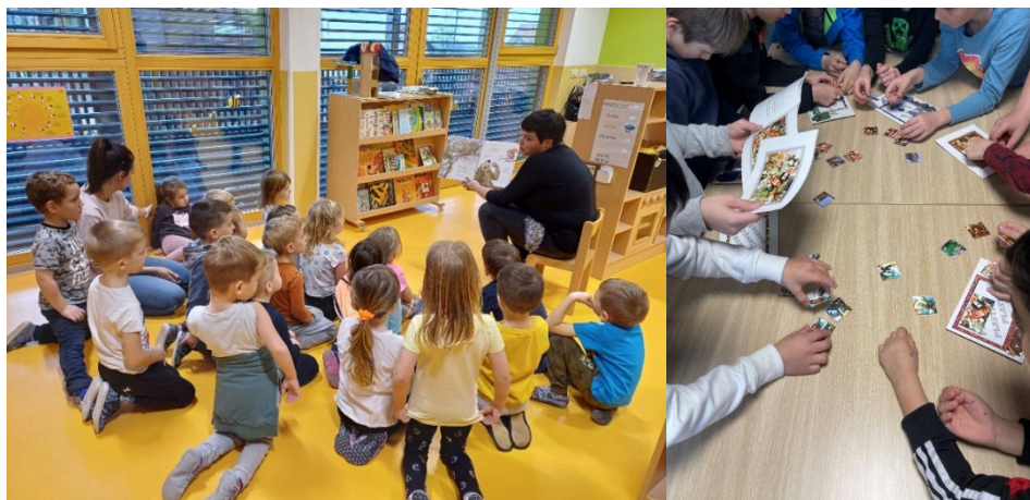
Slike 24 in 25: Bibliopedagoške ure za OŠ in oddelke vrtca

Bibliopedagoške ure za osnovnošolce: za učence tretjega razreda OŠ Šentjernej smo izvajali bibliopedagoške ure z ekološko obarvano tematiko in s tem sodelovali pri opravljanju eko bralne značke. Na obisk v knjižnico so prišli tudi učenci prvega, drugega, četrtega in sedmega razreda.