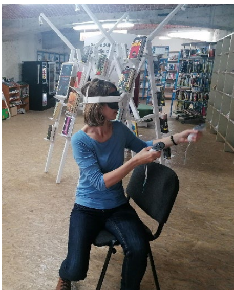
Slika 52: V sklopu Tedna znanstvene fantastike in fantazije so se ljubitelji vesolja in sodobne tehnologije lahko podali na virtualni sprehod po mednarodni vesoljski postaji.

V tednu od 13. do 17. maja 2024 smo pripravili prvi teden znanstvene fantastike in fantazije. Vabili smo k izposoji znanstveno-fantastične in fantazijske literature ter filmov, dostopnih preko spletnih portalov Baza slovenskih filmov in Kanopy. Fantazijsko so bile obarvane tudi ure pravljic in ustvarjalne delavnice, ljubitelje vesolja in sodobne tehnologije pa smo skupaj s Centrom vesoljskih tehnologij Hermana Potočnika Noordunga povabili na virtualni sprehod po mednarodni vesoljski postaji.