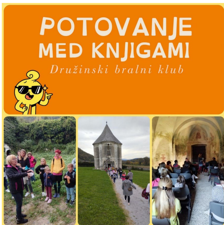
Slika 4: Družinski bralni klub