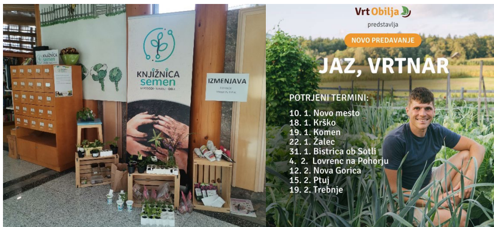
Sliki 59 in 60: Izmenjava semen in sadik v novomeški knjižnici in predavanje Vrta obilja »Jaz, vrtnar«

Vrta obilja z naslovom Jaz, vrtnar, v maju organizirali izmenjavo semen in sadik ter sodelovali na Zeleni tržnici v Stopičah, v novembru pa smo se udeležili 3. srečanja skrbnikov Knjižnic semen, ki je potekalo v Knjižnici Rogaška Slatina. Knjižnica semen je konec leta 2024 beležila 385 uporabnikov, ki so v preteklem letu vnesli v bazo knjižnice semen 129 različnih semen in si izposodili 468 vrečk semen.