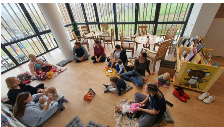
Slika 32: srečanja zaUPAMsi

Že drugo sezono zapored smo izvajali mesečna srečanja, na katerih smo se v obliki ženskih krogov pogovarjali na določeno temo, ki naslavlja ženske v novem, lepem, a težavnem življenjskem obdobju. Projekt je bil s strani mladih mamic zelo dobro sprejet, udeleženke so povedale, da se na srečanjih odlično počutijo in odidejo domov polne energije in dobre volje.