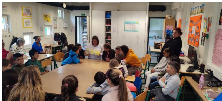
Slika 45: Pravljične urice z ustvarjalno delavnico za romske otroke v Večnamenskem romskem centru

Izvedba srečanj oz. igralnih uric s knjigo za romske otroke v Večnamenskem romskem centru Novo mesto.