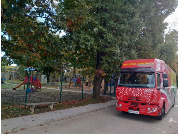
Slika 6: Obisk bibliobusa - Vrtec Ostržek v Bršljinu

Sodelovanje na Festivalu mladih: predstavitev bibliobusa in Knjižnice Mirana Jarca Novo mesto na Festivalu mladih na Loki v Novem mestu.