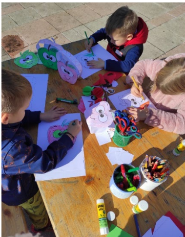
Slika 11: Ustvarjalna delavnica na prireditvi Topliško jabolko

Predšolska bralna značka Mavrična ribica , ki so jo otroci vestno opravili.