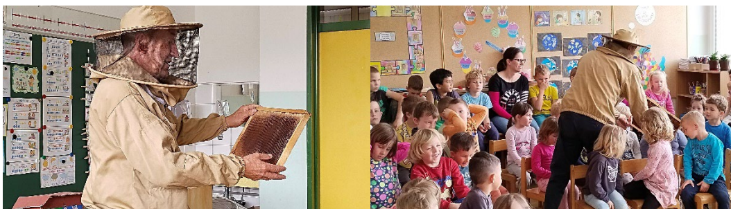
Sliki 38 in 39: Obisk čebelarja