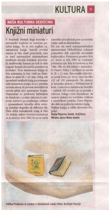
Slika 50: Publicistična dejavnost: predstavitev gradiva iz Posebnih zbirk Boga Komelja v časniku Dolenjski list

Publicistična dejavnost knjižnice z bogato kulturno dediščino je pomemben prispevek k prepoznavanju knjižnice in okolja, v katerem deluje, skozi čas.