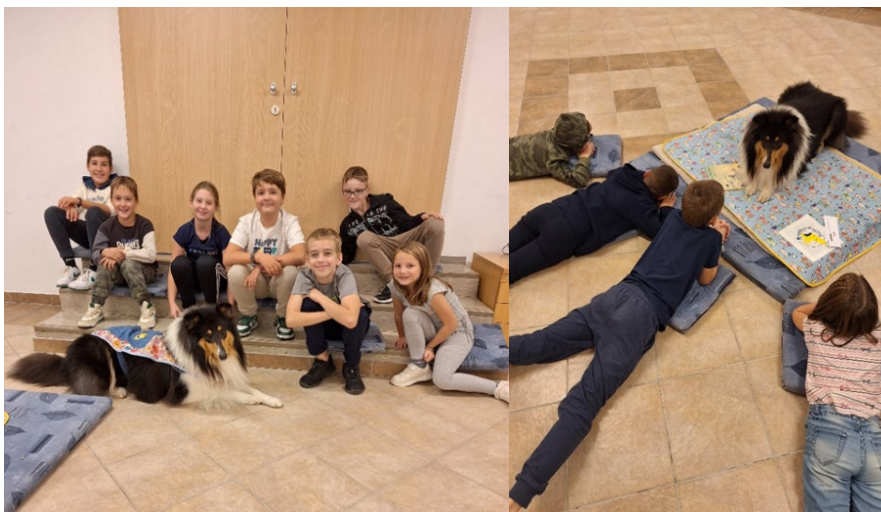
Sliki 30 in 31: Branje s tačkami

Beremo s tačkami: v sklopu projekta Branje s tačkami, ki poteka v sodelovanju s Slovenskim društvom za terapijo s pomočjo psov Tačke pomagačke, branje s tačkami poteka enkrat mesečno. S posebno metodo – otrok bere psu – pomagamo otrokom izboljšati bralne in komunikacijske sposobnosti.