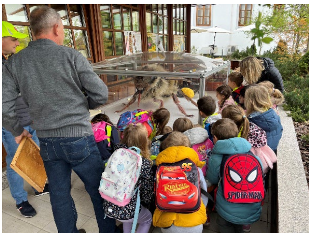
Slika 51: Čebelo velikanko na terasi knjižnice si je v mesecu dni, ko je bila na ogled, ogledalo preko 3.000 obiskovalcev.